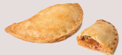
12499 Empanadilla Selecta de Pollo 125g