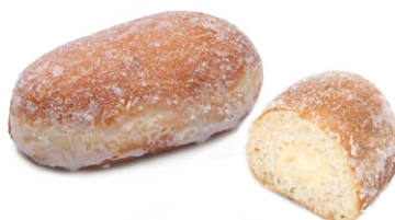
13323 ✨ Mini Pepito Crema Azucarado 55g