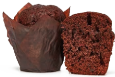
130519 ✨ Mini Muffin de Chocolate 30g