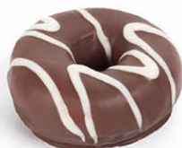
13186 ✨ Mini Dona Bombón Rayada 34g

Una variada gama de Donas y Pepitos elaborados al más puro estilo americano. Rápidos y fáciles, no necesitan ningún tipo de manipulación, tras unos minutos de descongelación están listos para servir. Irresistibles por su masa tierna y esponjosa, deliciosos rellenos y exquisitas coberturas y decorados ¡Frescos de principio a fin!