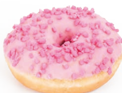
21482 ✨ Dona Super Pink 55g