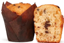
130521 ✨ Mini Muffin de Vainilla 30g