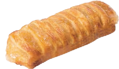
21493 Rejita Manzana con Canela 70g