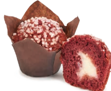
130513 Muffin Red Velvet 95g