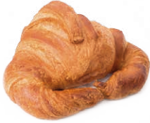
13922 ✨ Croissant Artes. Margarina Ferm. 90g