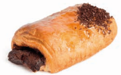
130157 Napolitana Crema de Choco Ferm. 70g