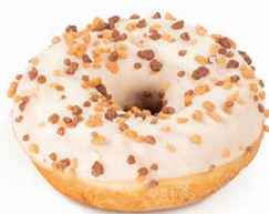
13125 ✨ Dona Crunchy Mix 55g