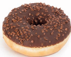
21498 ✨ Dona Super Choco 55g