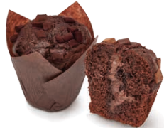
130511 Muffin Choco Bomb 110g