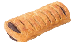
21492 Rejita Crema Cacao c/Avellanas 70g