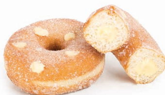
13332 ✨ Dona Azucarada rell. de Crema 75g