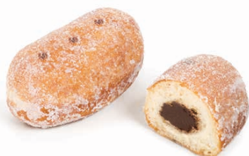
13319 ✨ Mini Pepito Cacao Azucarado 55g