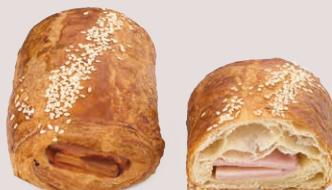
21641 ✨ Napolitana Mixta York y Queso Ferm. 140g