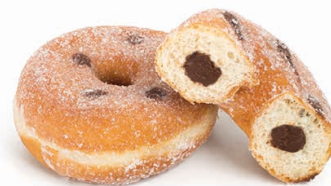
21557 ✨ Dona Azucarada rell. Choco c/Avellanas 75g