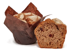
130687 Muffin Cappuccino 95g