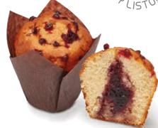
130510 Muffin Passion Red 110g