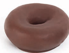
21482 ✨ Dona Bombón 55g