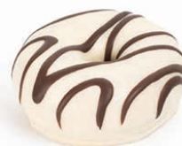
13188 ✨ Mini Dona White Rayada 38g