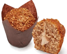
130509 Muffin Nuts & Cream 110g