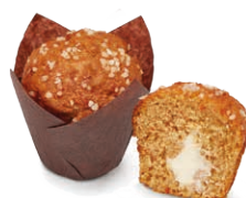
130514 Muffin Carrot Cake 95g