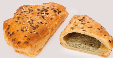
12544 ✨ Empanadilla Hojaldre Espinacas y Queso 120g

Los snacks salados incrementan los momentos de consumo: desayunos, meriendas, comidas, cenas, entre comidas, para llevar. Ofrecemos una gama de productos con rellenos sabrosos y generosos, tanto tradicionales como innovadores.