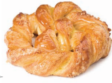
21640 ✨ Bretzel Crema 125g