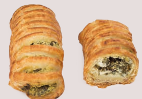
12981 ✨ Rejita Espinaca y Ricotta 70g