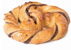
21584 ✨ Bretzel Chocolate 125g